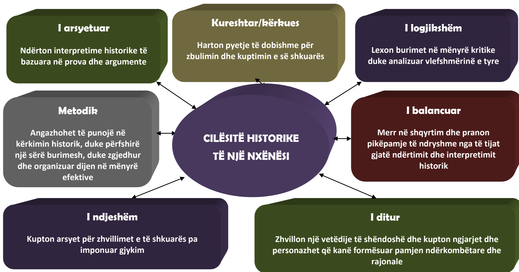
Digrami 5. Cilësitë historike të nxënësit