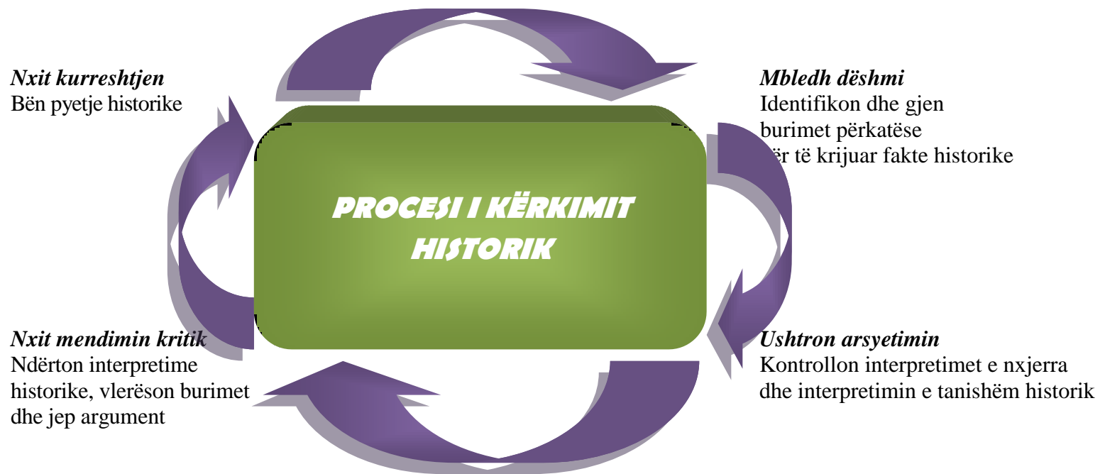
Figura 1. Procesi i kërkimit historik

Përdorimi i kërkimit historik u paraqet nxënësve një mënyrë për të bërë hulumtime, për të organizuar dhe për të shpjeguar ngjarjet që kanë ndodhur. Kërkimi historik është procesi i "të bërit histori". Ai është një proces ciklik (Figura. 1), që fillon me shtrimin e pyetjeve historike, pasohet nga gjetja dhe analiza e burimeve historike për të krijuar fakte dhe dëshmi historike. Dëshmia historike përdoret më pas për të ndërtuar interpretimet historike që kërkojnë t'iu përgjigjen pyetje historike.